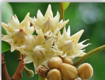
ดอกพิกุล

ดอกไม้ประจำวิทยาลัยอาชีวศึกษาเมืองชัยภูมิ