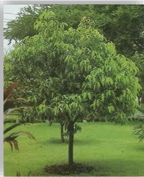
ต้นพิกุล

ต้นไม้ประจำวิทยาลัยอาชีวศึกษาเมืองชัยภูมิ