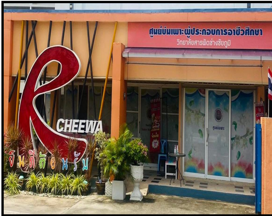
ภาพที่ ๑ สำนักงานศูนย์บ่มเพาะผู้ประกอบการอาชีวศึกษา