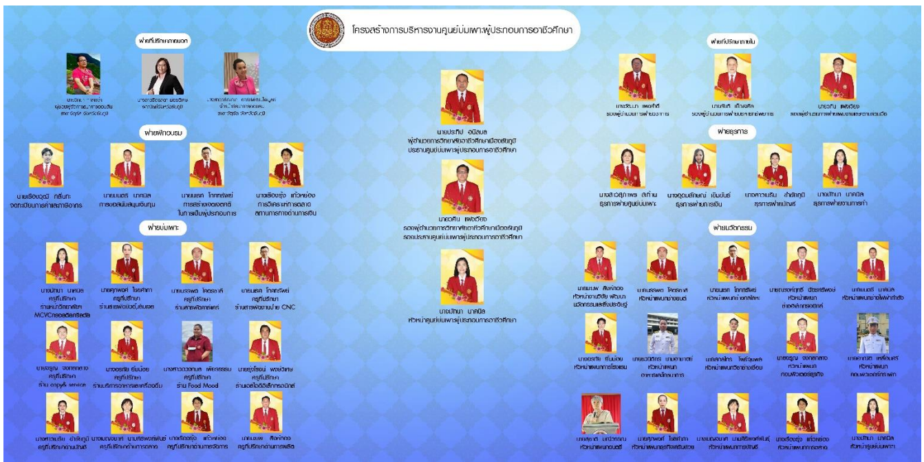
ภาพที่ ๔ โครงสร้างการบริหารศูนย์บ่มเพาะผู้ประกอบการอาชีวศึกษา

วิทยาลัยอาชีวศึกษาเมืองชัยภูมิได้แต่งตั้งคณะกรรมการตามโครงสร้างการบริหารศูนย์บ่มเพาะผู้ประกอบการอาชีวศึกษา ประจำปีการศึกษา ๒๕๖๖ ดังนี้