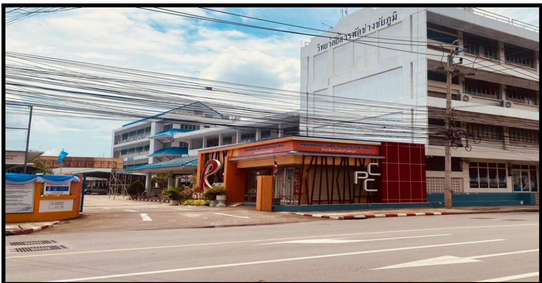
ภาพที่ ๒ สำนักงานศูนย์บ่มเพาะผู้ประกอบการอาชีวศึกษาที่ตั้ง อยู่ในทำเลที่เหมาะสมเป็นสัดส่วน