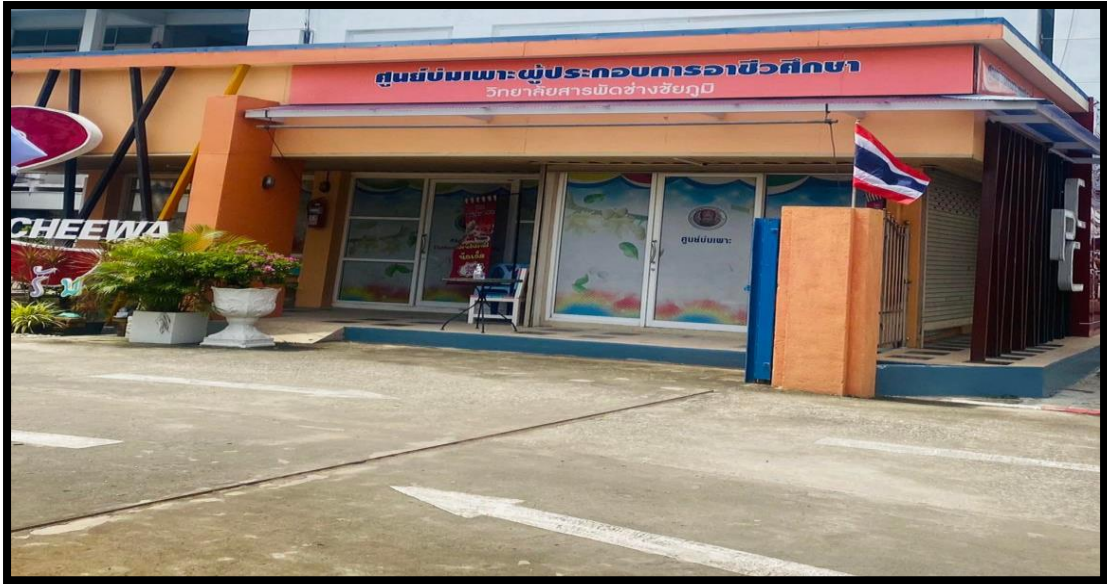
ภาพที่ ๓ สำนักงานศูนย์บ่มเพาะผู้ประกอบการอาชีวศึกษาสะดวกต่อการติดต่อ